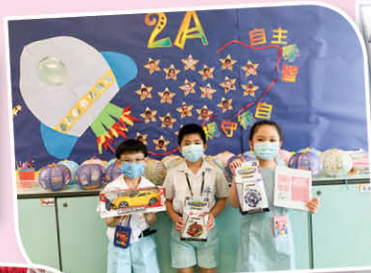
叻我至叻獎勵計劃