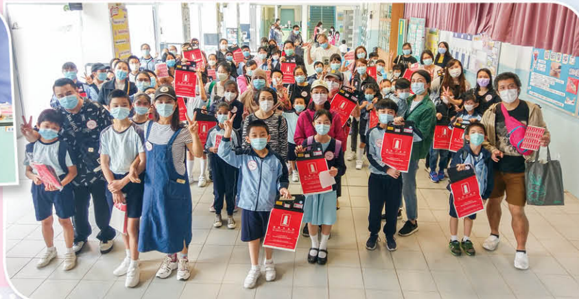
義工服務—公益金賞旗日