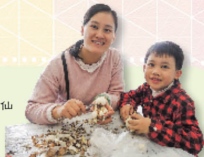
親子剝水仙花頭活動