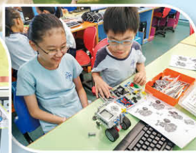
電腦機械應用課程