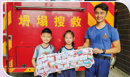
二年級專題研習 為我們服務的人