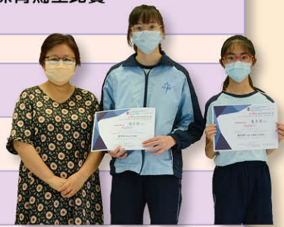
第十屆「春雨主題曲歌唱比賽」決賽：優異獎