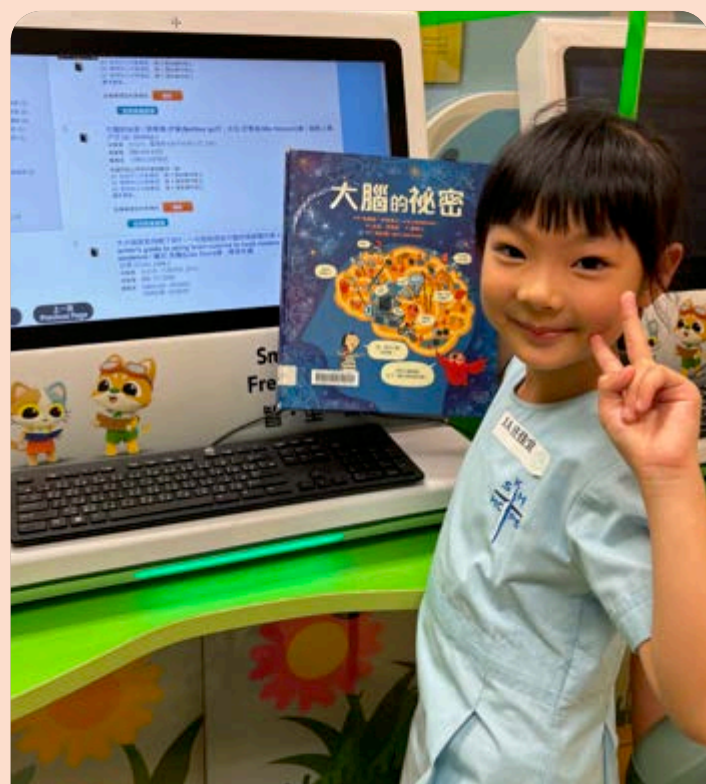
「5月4日九龍城智能漂書櫃啟動禮」