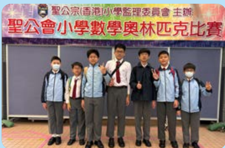
聖公宗(香港)小學監理委員會 主辦 聖公會小學數學奧林匹克比賽

本校設有小三至小六奧數班，更成立奧數校隊，鼓勵學生參加校外比賽，如：聖公會小學奧林匹克數學比賽、全港小學數學奧林匹克邀請賽、華夏盃及港澳盃等，讓學生從多元化的學習經歷中，建立自信、擴闊視野。