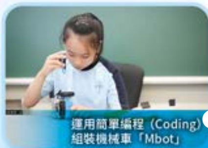
運用簡單編程 (Coding) 組裝機械車「Mbot」