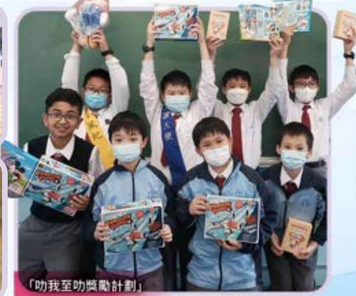
「叻我至叻獎勵計劃」