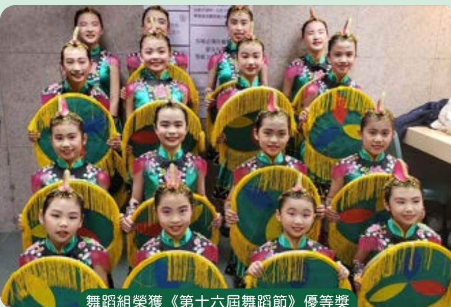
舞蹈組榮獲《第十六屆舞蹈節》優等獎