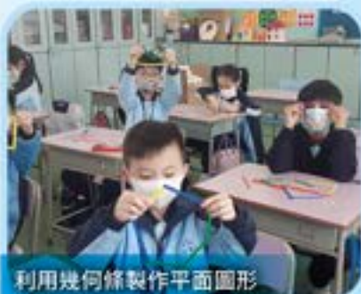
利用幾何條製作平面圖形

為發展學生協作、解難及創意思維的能力，課堂中透過實作學習活動，讓學生進行探究及動手作，將抽象的概念具體地展現出來。