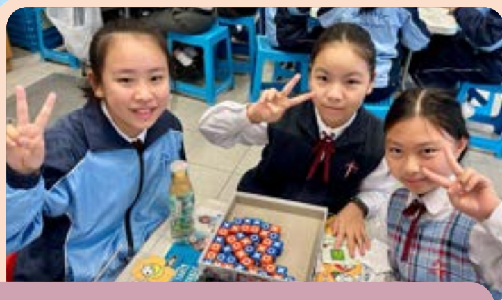
同學們在閱讀日玩遊戲。

閱讀活動包括：九龍城區青年閱讀獎勵計劃、夢想閱讀計劃、躍變龍城水墨畫故事工作坊、聯校書籤分享比賽、全港學生書籤交換計劃、「平凡人的不平凡」人物專訪比賽、圖書館社區服務日、「我們一起悅讀的日子」、閱讀繪本活動、香港迪士尼樂園參觀活動、作家講座、家長日書展等。