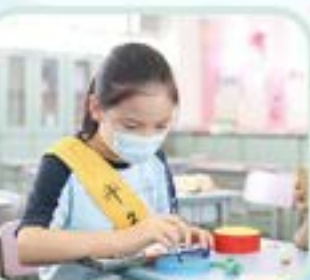
趣味繪畫及小手工

趣味繪畫及小手工 英文故事 小小書法家 Scratch 遊戲設計 魔術 急救小先鋒 趣味語文遊戲