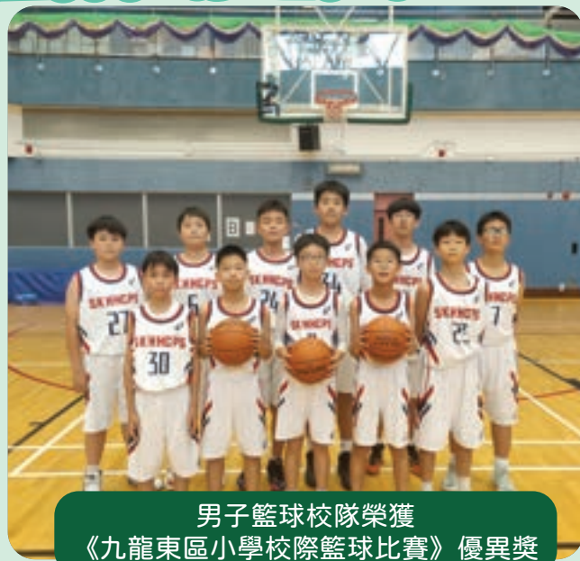
男子籃球校隊榮獲 《九龍東區小學校際籃球比賽》優異獎