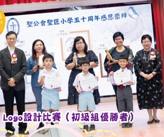
Logo設計比賽（初級組優勝者）