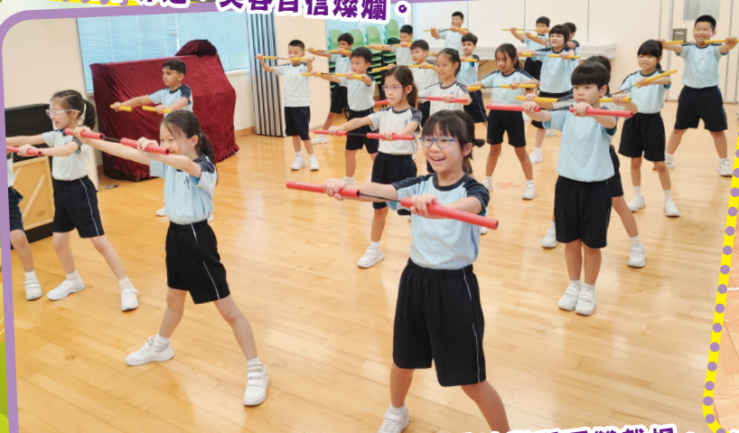
在OLE課堂，同學們氣勢十足地學習耍雙截棍。