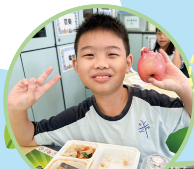
靜觀吃蘋果： 同學在進食過程中練習靜觀