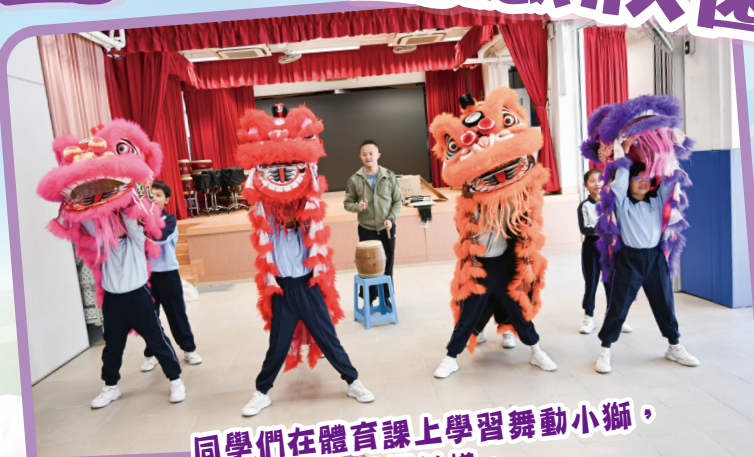
同學們在體育課上學習舞動小獅，似模似樣。