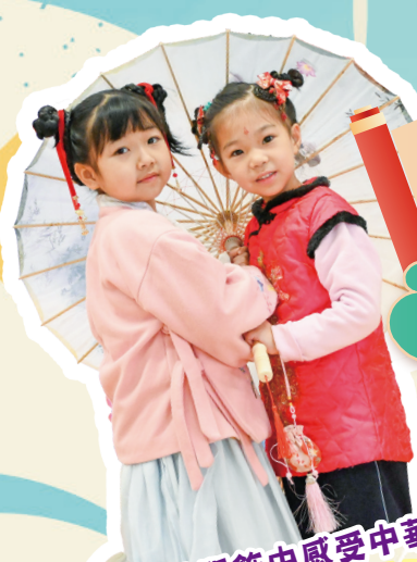
從傳統服飾中感受中華美好