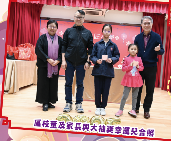
區校董及家長與大抽獎幸運兒合照