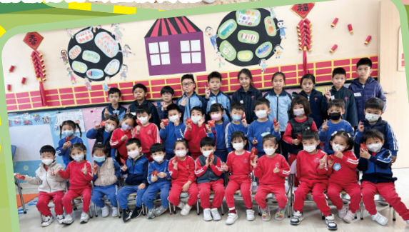
四年級同學們到幼稚園進行環保教育活動