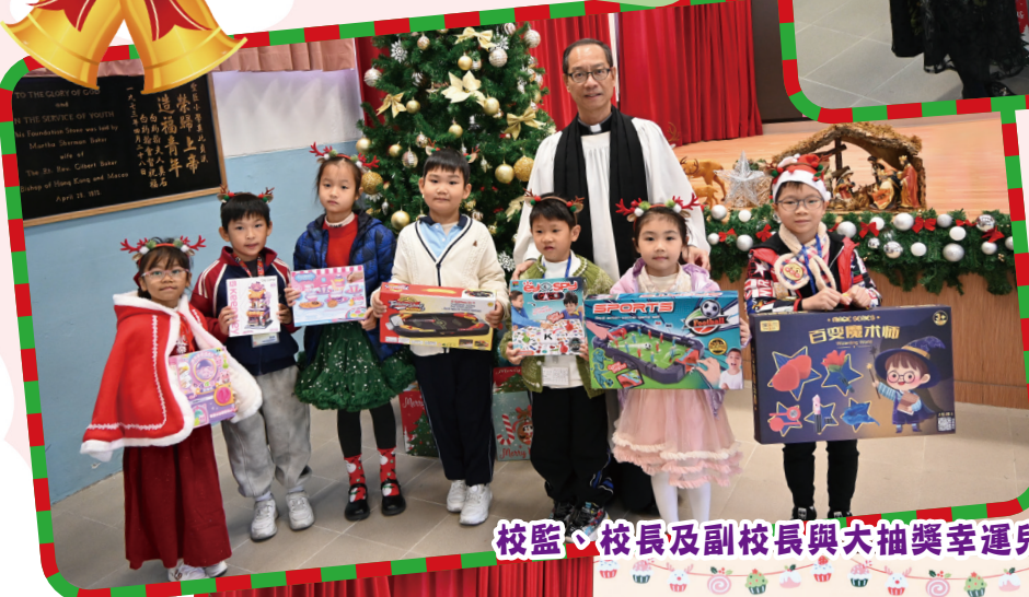
校監、校長及副校長與大抽獎幸運兒合照