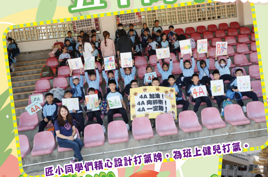
匠小同學們精心設計打氣牌，為班上健兒打氣。