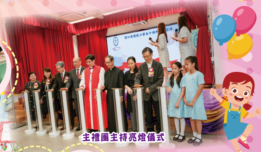
主禮團主持亮燈儀式