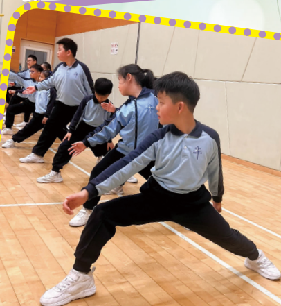
同學們到啟德體藝館學習劍擊，氣勢十足。