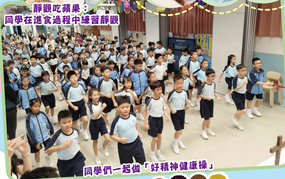
同學們一起做「好精神健康操」