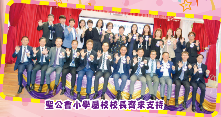
聖公會小學屬校校長齊來支持