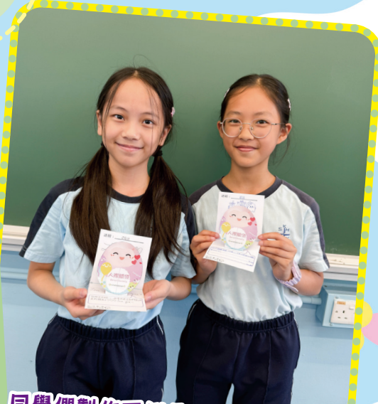
同學們製作不倒翁立體心意卡， 寫下鼓勵和支持的說話給朋友。