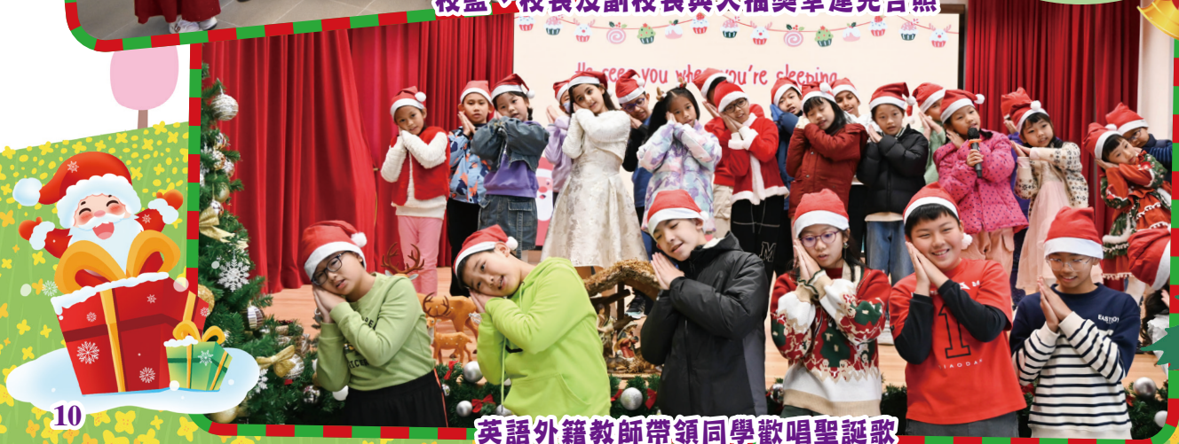
英語外籍教師帶領同學歡唱聖誕歌