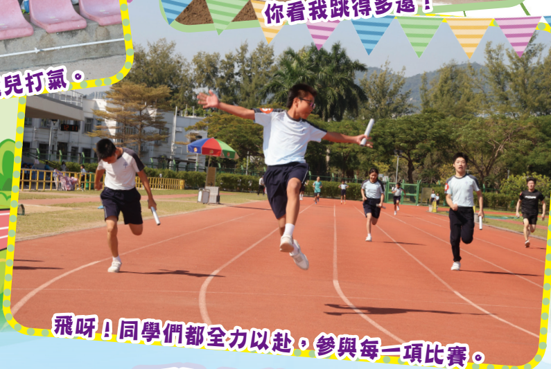
飛呀！同學們都全力以赴，參與每一項比賽。