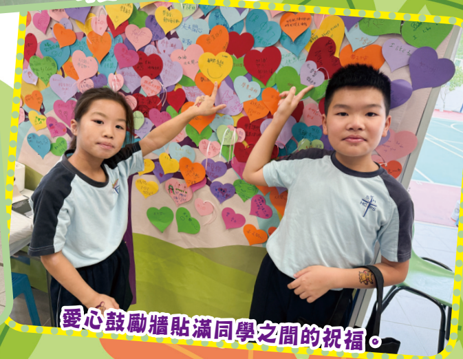
愛心鼓勵牆貼滿同學之間的祝福。