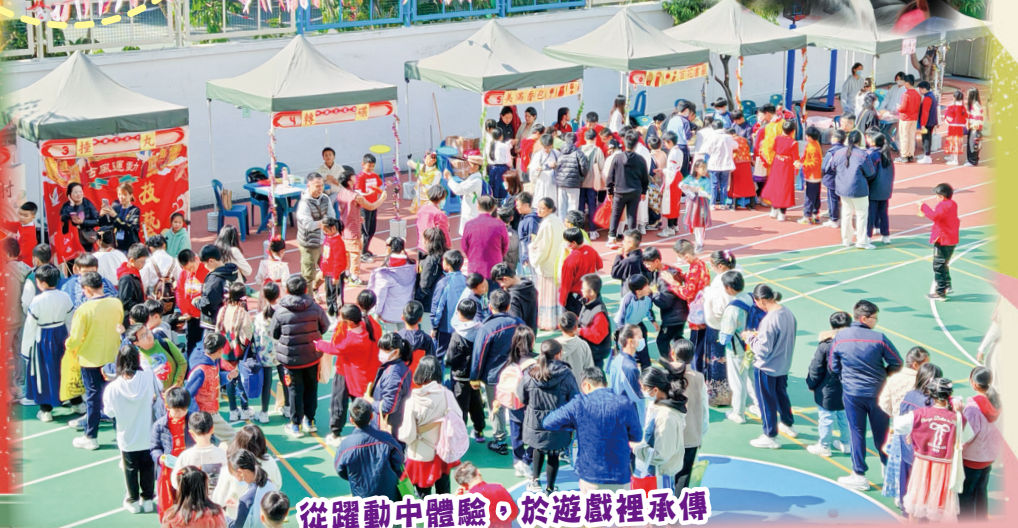
從躍動中體驗，於遊戲裡承傳