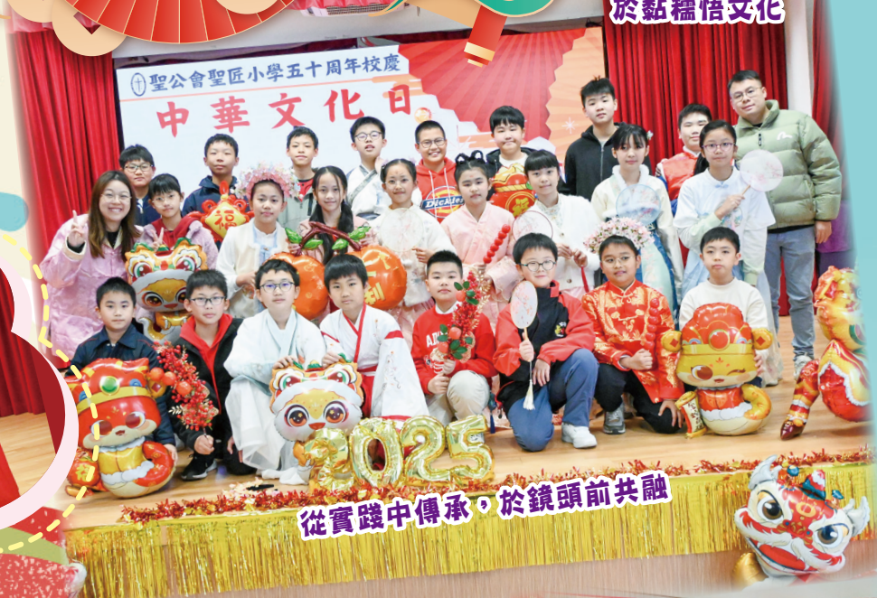
從實踐中傳承，於鏡頭前共融