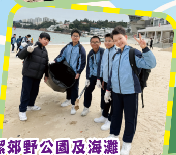
五、六年級同學們清潔郊野公園及海灘