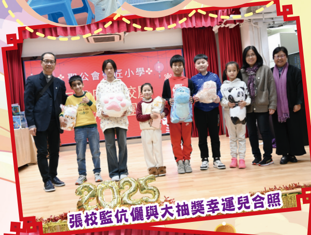
張校監伉儷與大抽獎幸運兒合照