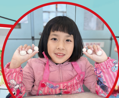
學習搓湯圓，有板有眼呢！