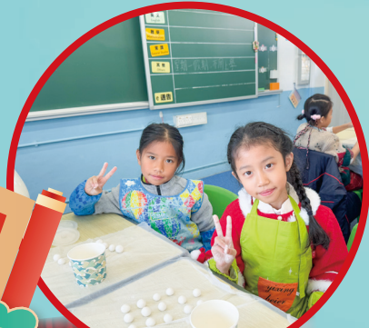
從揉捏見傳承，於黏糯悟文化