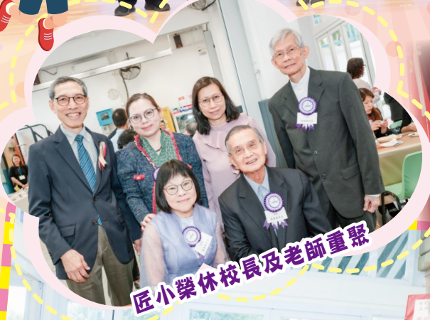
匠小榮休校長及老師重聚