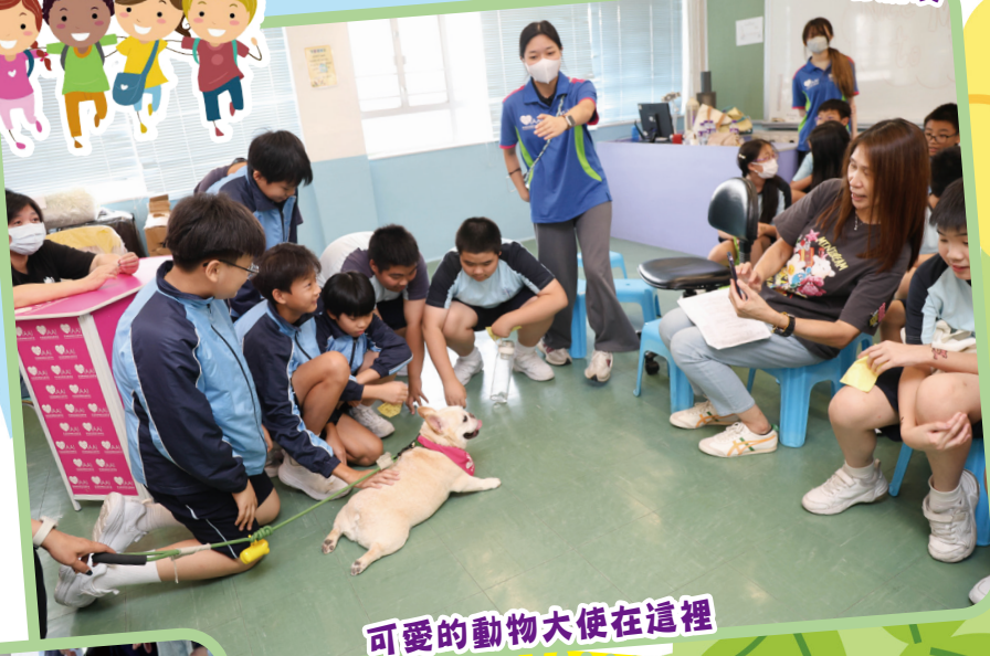
可愛的動物大使在這裡