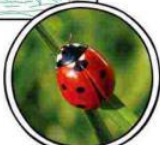
瓢蟲是大膽的紅黑配色。

當然，博物館裡面有一些不常見的昆蟲鳥類——也可以是配色靈感，這些都是大自然巧妙的設計。