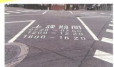
許多學校前的大馬路都會設置「行人專用時相」。上下學期間，行人綠燈時，所有車輛都是紅燈，直行、轉彎都禁止，讓學生可以安全過馬路。

假設馬路只有車子能走，腳踏車、行人都沒有專屬道路，會怎樣？當走路太危險，爸媽可能會堅持接送你上、下學，你沒辦法跟同學邊走邊聊天。行動不便的老人家、輪椅族，甚至只是沒錢買車的人，也必須在危險的馬路邊走上一段路，才能