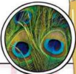
孔雀羽毛則是藍綠配色。