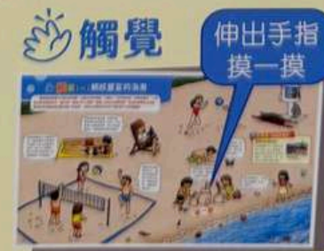
海灘沙粒的顆粒感 P.39