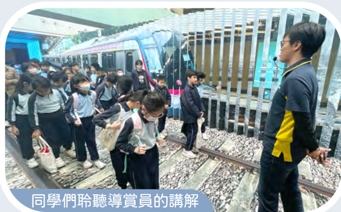
同學們聆聽導賞員的講解

三年級同學參觀「站見」鐵路展，認識了港鐵的歷史及背後鐵路系統的運作。同學們對於導賞員的講解都十分雀躍。