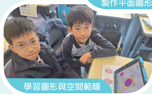
學習圖形與空間範疇