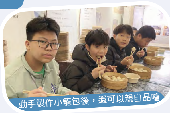
動手製作小籠包後，還可以親自品嚐