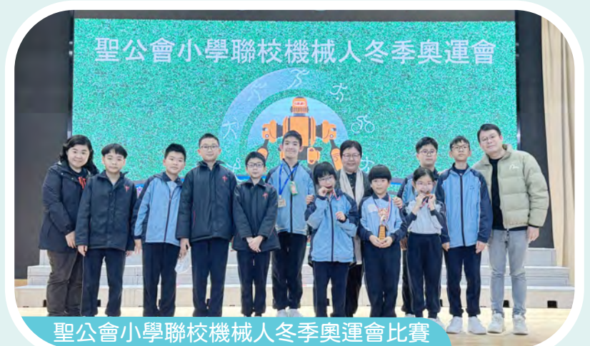
聖公會小學聯校機械人冬季奧運會比賽

為了提升培養學生的創意及運算思維能力，本校增設了多項編程興趣班，如：機械應用校隊班、機械應用中班、機械應用初班，讓同學們透過工作坊學習拼砌Lego Spike Prime，並學習相關編程。同學們積極投入參與，並發揮創意及合作精神。