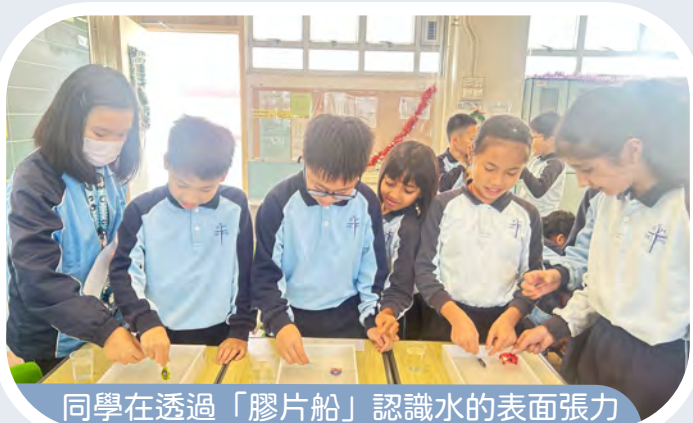
同學在透過「膠片船」認識水的表面張力