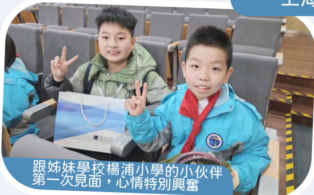
跟姊妹學校楊浦小學的小伙伴第一次見面，心情特別興奮