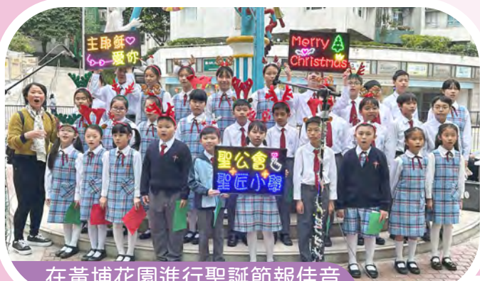
在黃埔花園進行聖誕節報佳音