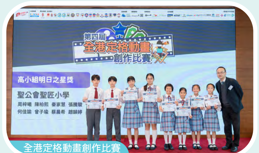
全港定格動畫創作比賽

校方鼓勵學生參加校外比賽，如：聖公會小學聯校機械人冬季奧運會比賽、全港定格動畫創作比賽等，讓學生擴闊眼界和增強自信。