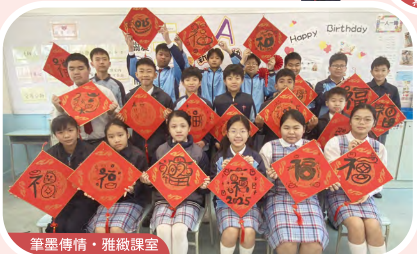
筆墨傳情·雅緻課室

夢飛行合家歡劇團來臨，為一至三年級的學生帶來一場精彩的《語文特攻隊~標點戰士》音樂劇。劇團以生動有趣的演繹方式，跟學生一起探索運用標點時遇到的各種難題，並教導學生運用的技巧。學生們看得非常投入，他們積極參與，踴躍回答問題，期望他們能學以致用，提升語文能力！