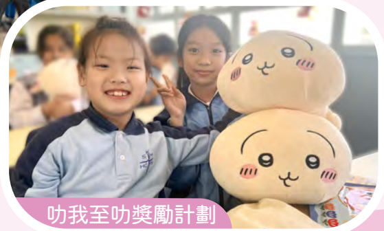
叻我至叻獎勵計劃