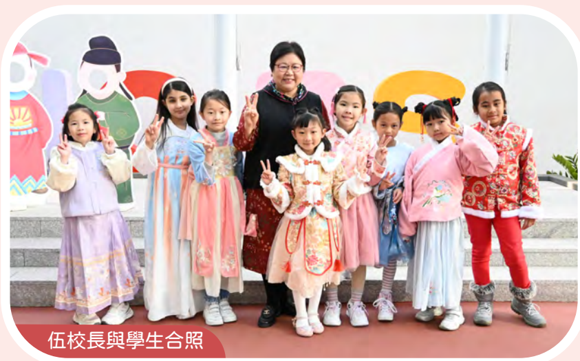
伍校長與學生合照