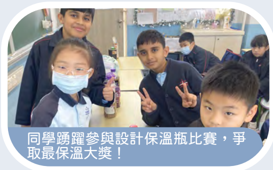
同學踴躍參與設計保溫瓶比賽，爭取最保溫大獎！