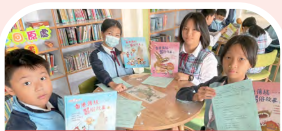
典籍潤心，書香致遠——中華經典書籍閱讀活動

為弘揚中華文化，學習傳統美德，本校舉辦中華文化日，全校師生一起透過體驗式學習，感受中華體藝的獨特魅力，以身為中國人為榮。