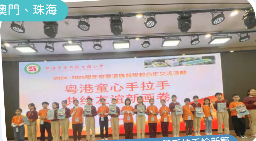
與姊妹學校珠海市香洲區文園小學手拉手繪新篇