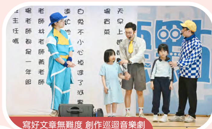
寫好文章無難度 創作巡迴音樂劇